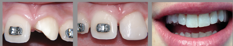
RICOSTRUZIONI ESTETICHE SU FRATTURE DENTALI